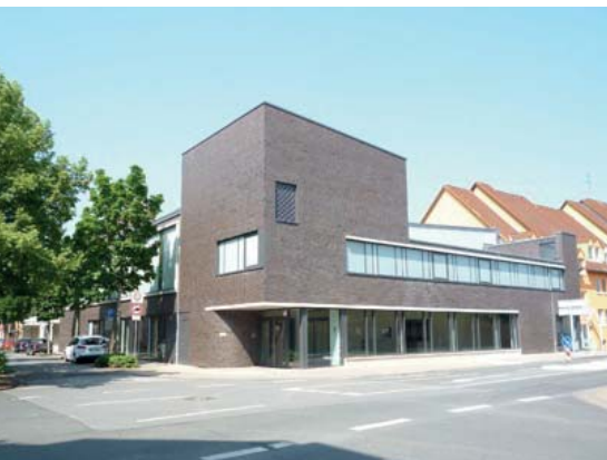
Auswahl der durch KIPS bewerteten Gebäude im Erzbistum Paderborn.